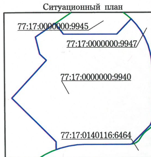
Координаты границ земельного участка